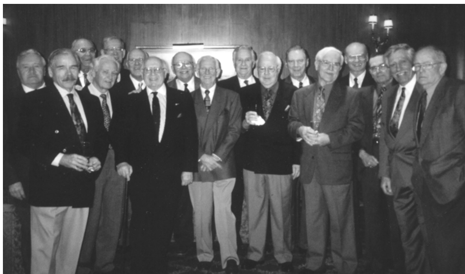
Photo prise lors d'une des fameuses réunions.